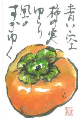
東京都北区 H. A

新米をお送り下さり感謝でございます。生産者のご苦勞にも共に感謝でございます。ふるさと綾部に思いを馳せながら頂戴いたします。 京都府福知山市 I. K