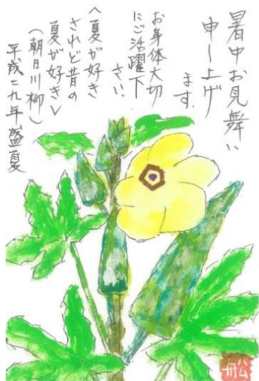
大阪府藤井寺市 F. S

※誌面の都合上、時候の挨拶等、一部割愛させていただいておりますので、ご了承ください。